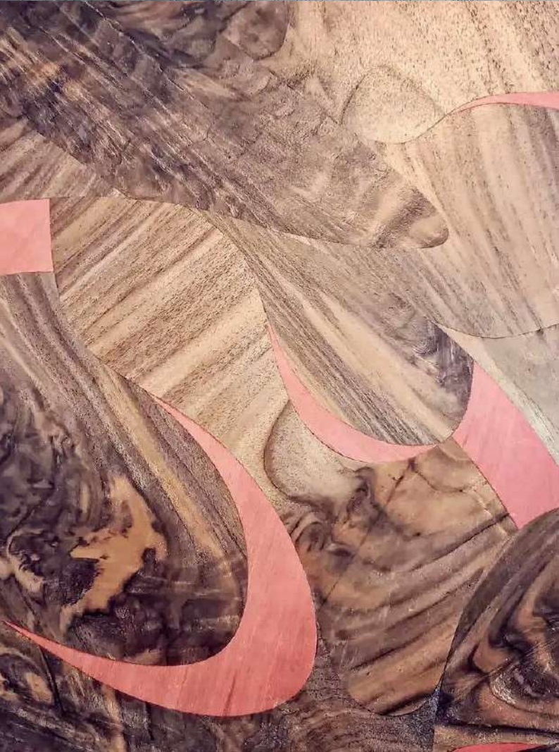
Table basse plaquée de marqueterie de ronce de noyer et de poirier teinté rose cerise. Piètement en tilleul teinté noir.