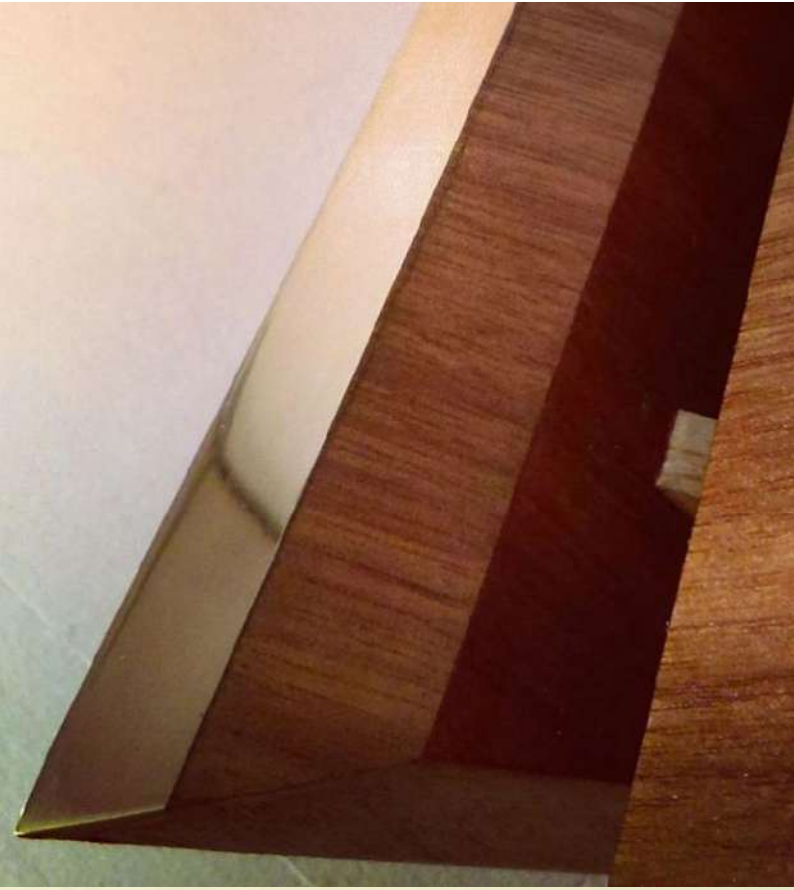
Coffret à bijoux plaqué de noyer avec incrustation de laiton.